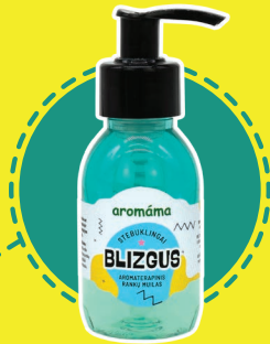
AROMATERAPINIO SKYSTO MUILO GAMYBA (iš natūralių ingredientų ir blizgučių)