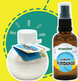
AROMATERAPINIO KAMBARIO PURŠKALO (iš natūralių eterinių aliejų) + VONIOS DRUSKOS GAMYBA