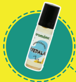
ALIEJINIŲ KVEPALŲ GAMYBA (iš natūralių ingredientų)