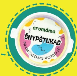
VONIOS ŠNYPŠTUKO GAMYBA (iš natūralių ir sintetinių ingredientų)