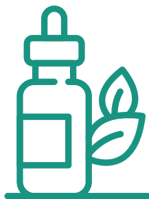
AROMATERAPINĖS KOSMETIKOS GAMINIAI