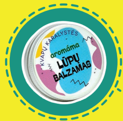
NATŪRALIOS SUDĖTIES LŪPŲ BALZAMO GAMYBA (iš ekologiškų augalinių ir eterinių aliejų)